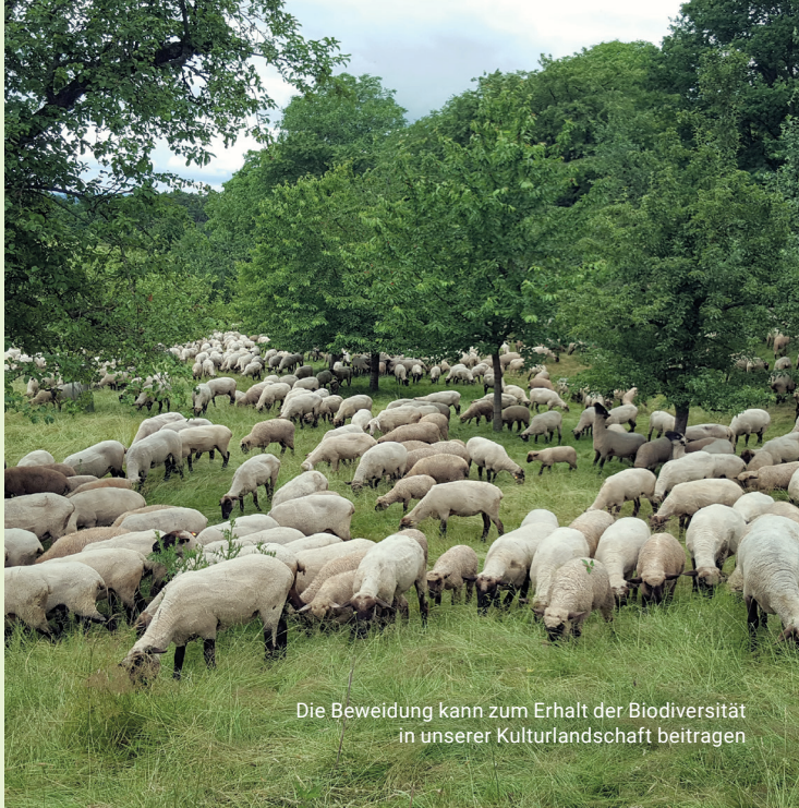
Die Beweidung kann zum Erhalt der Biodiversität in unserer Kulturlandschaft beitragen